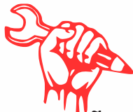
REPARAÇÃO DE ELETRODOMÉSTICOS